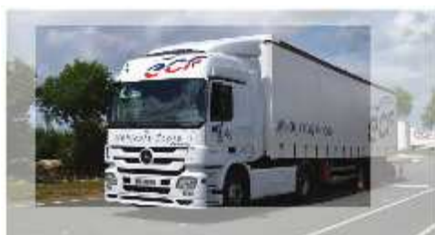
1 SEMI-REMORQUE (Catégorie CE)