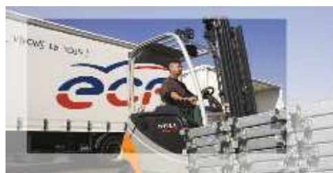
9 CHARIOTS ELEVATEURS Et engins de manutentions