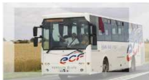
1 VEHICULES DE TRANSPORT EN COMMUN (Catégorie D)