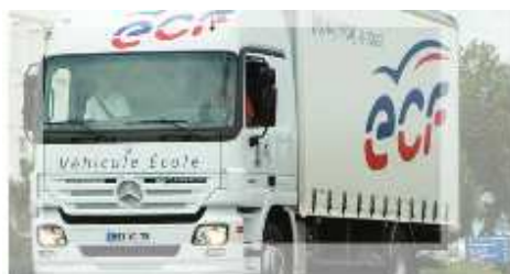
5 POIDS LOURS (Catégorie C)