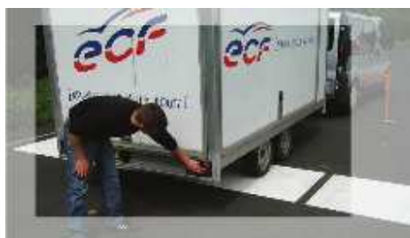
1 VEHICULE BE