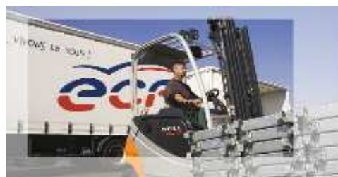
9 CHARIOTS ELEVATEURS Et engins de manutentions