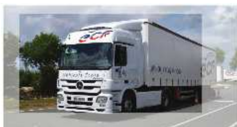
1 SEMI-REMORQUE (Catégorie CE)