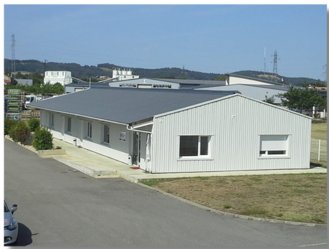
📍 Salle 1 - 2 - 3