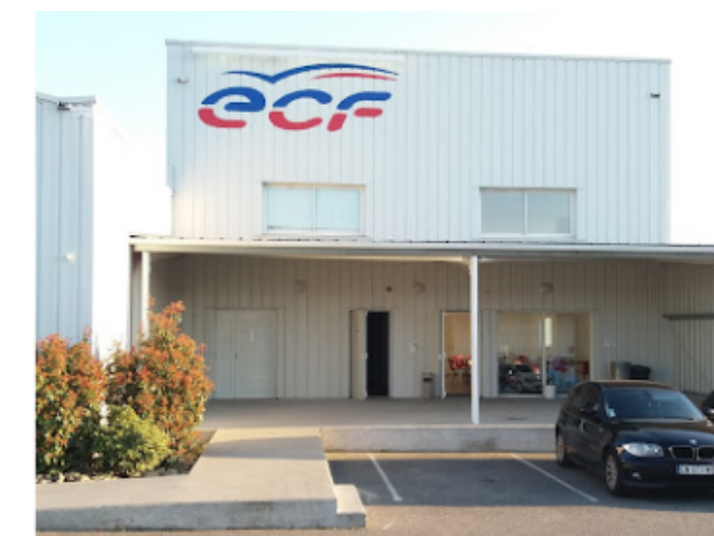
📍 W.C 📍 Cafétéria 📍 Salle 6 - 7 - 8