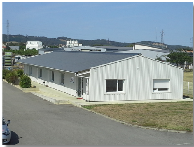
📍 Salle 1 - 2 - 3